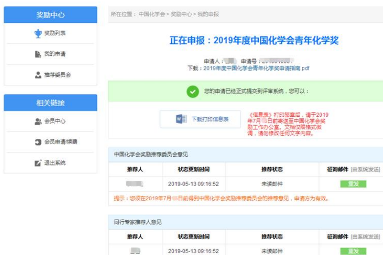
图 9 提交申请成功页面

当提交奖励申请成功后，页面将自动跳转至“我的申报”，点击“下载打印信息表”，导出申请人的《信息表》DOCX 文件（图 9）。导出后的文档只可修改格式，文字内容需与电子版保持一致。