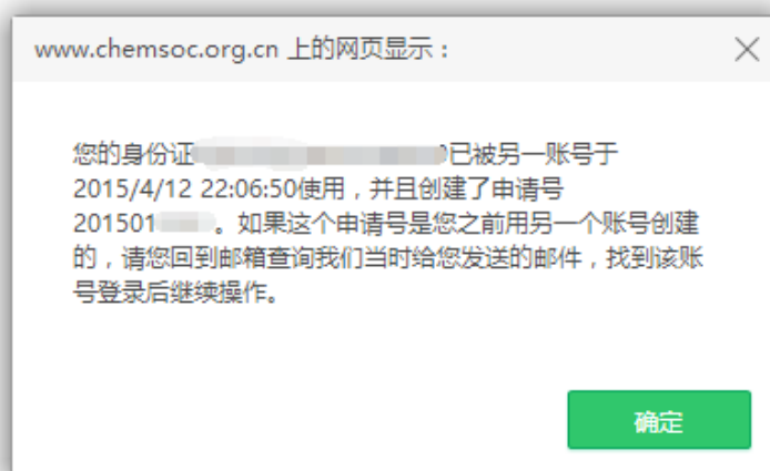
图 7 重复申报奖励提示页面

提示： 非中国化学会会员需先办理入会手续，成为个人会员后，再申报学会奖励。忘记会员证号的申请人可登录个人会员中心，查看会员证号。如果忘记登录密码，可通过注册时的邮箱和姓名重置密码。